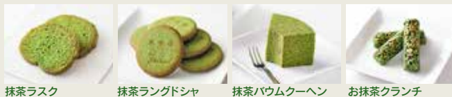
抹茶ラスク 抹茶ラングドシャ 抹茶パウムクーヘン お抹茶クラッチ

新作続々登場! 詳細は西条園HPで! http://www.saijoen.jp/